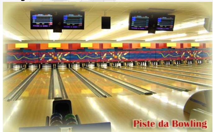
Piste da Bowling

Le iscrizioni dovranno pervenire entro e non oltre il 29 aprile 2005